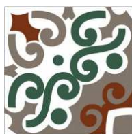
CA20NOVE-GR Novecento Green 20x20 CA-66