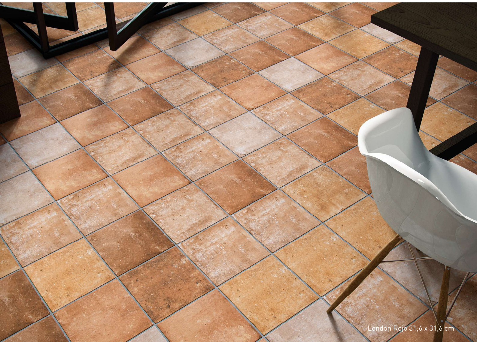
London Rojo 31,6 x 31,6 cm