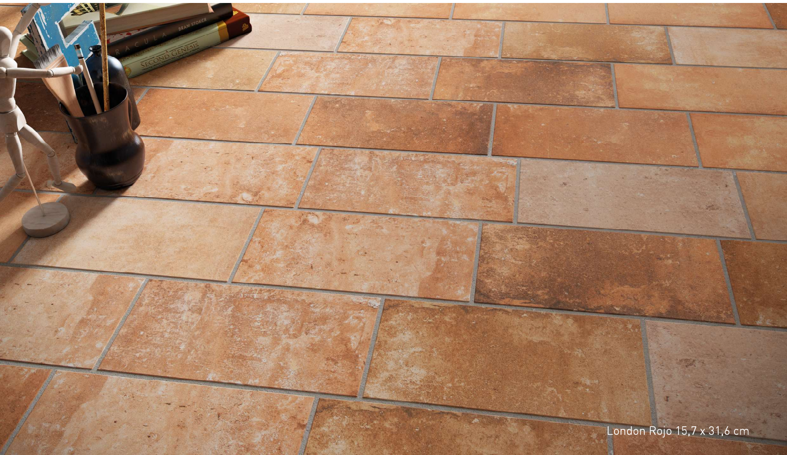
London Rojo 15,7 x 31,6 cm