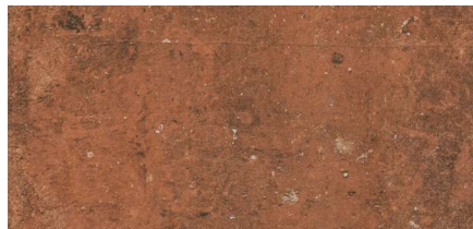
Tabica London Rojo 15,7 x 31,6 cm