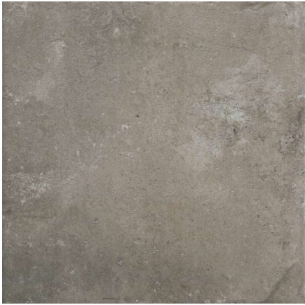
Base London Gris 31,6 x 31,6 cm