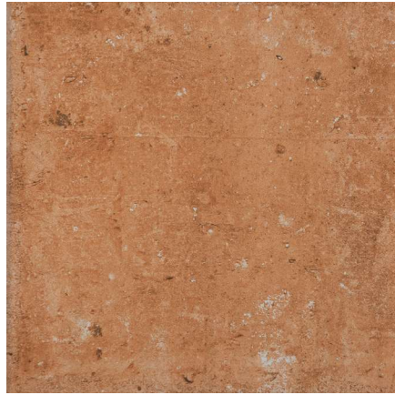
Base London Rojo 31,6 x 31,6 cm