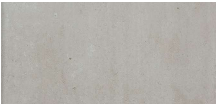
Tabica London Gris 15,7 x 31,6 cm