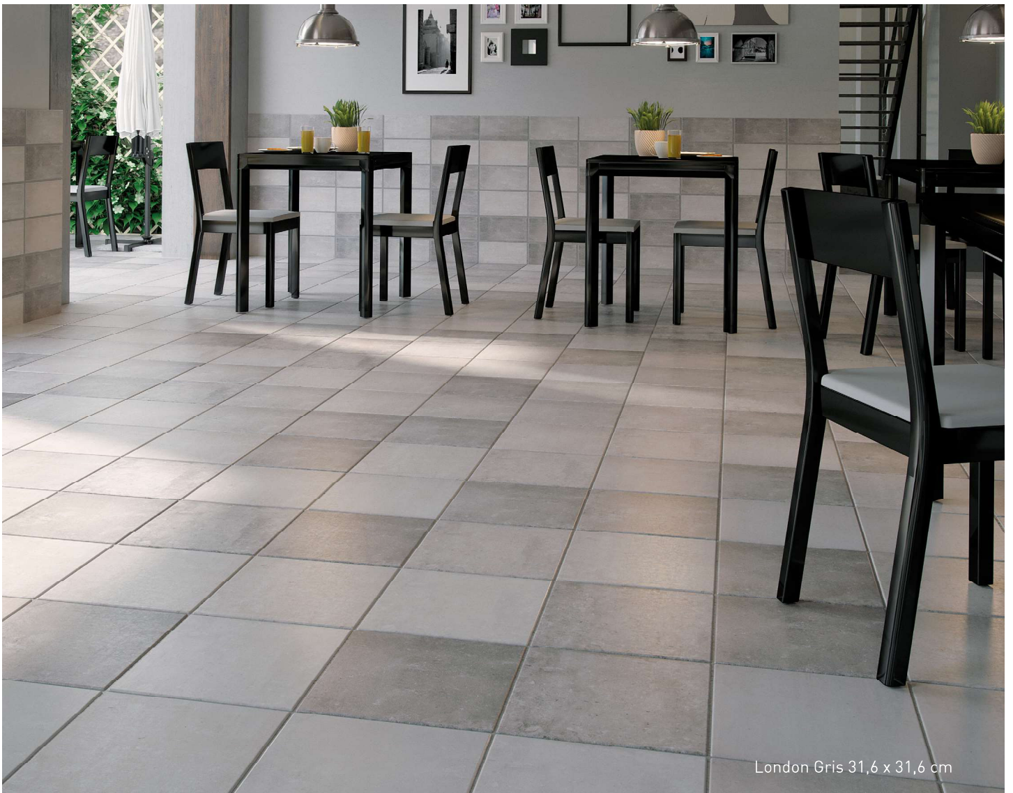
London Gris 31,6 x 31,6 cm