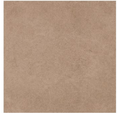
Siena Marrón 31,6 x 31,6 cm