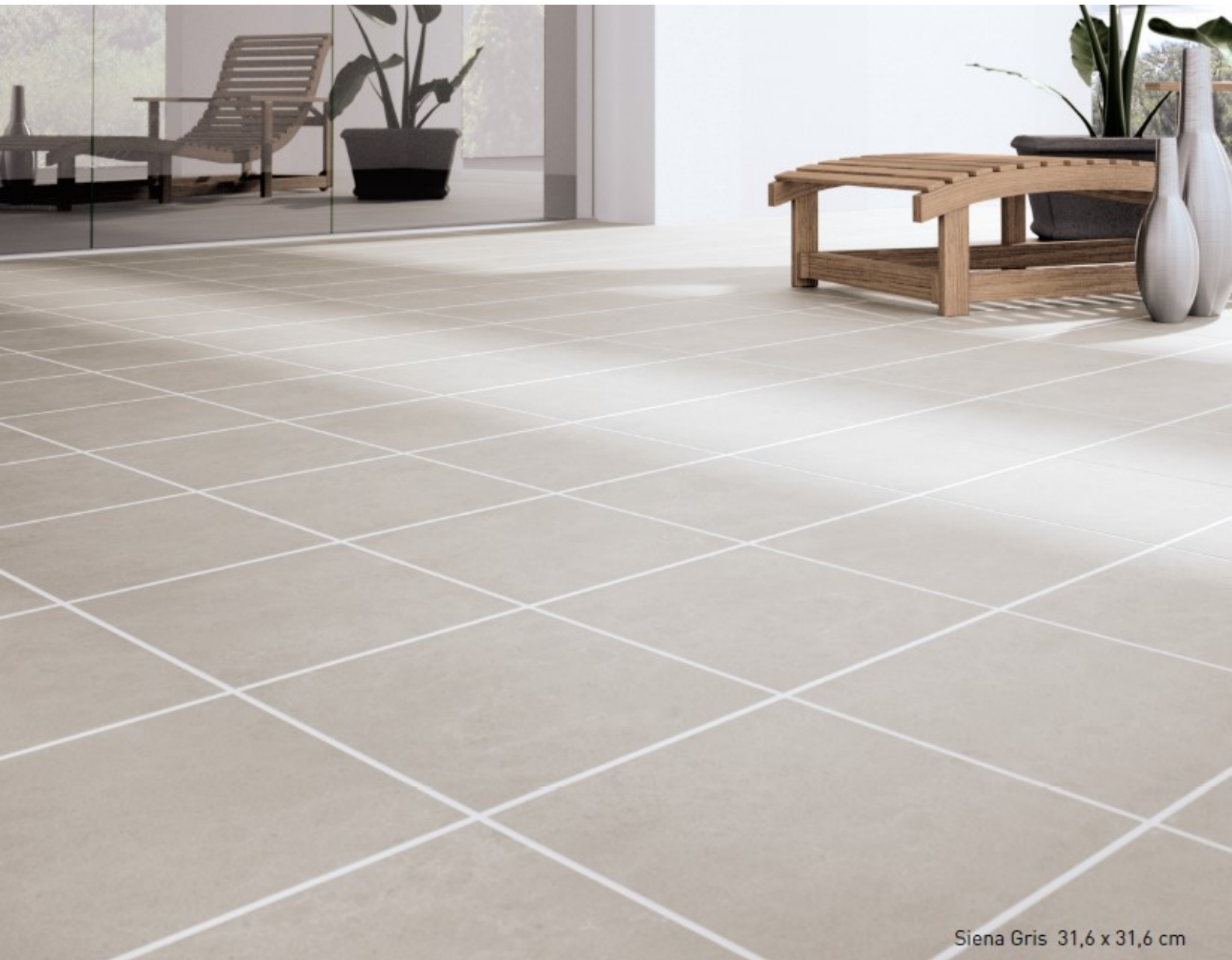
Siena Gris 31,6 x 31,6 cm