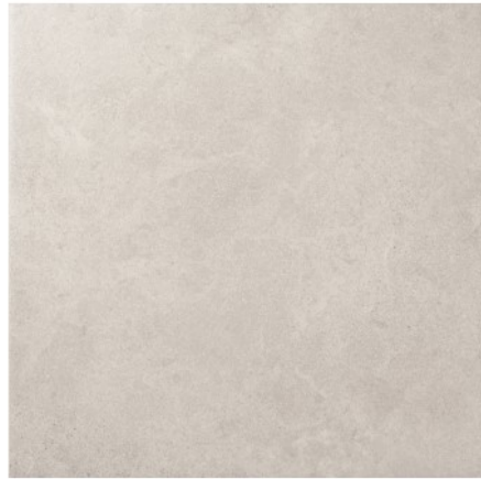
Siena Gris C1 31,6 x 31,6 cm