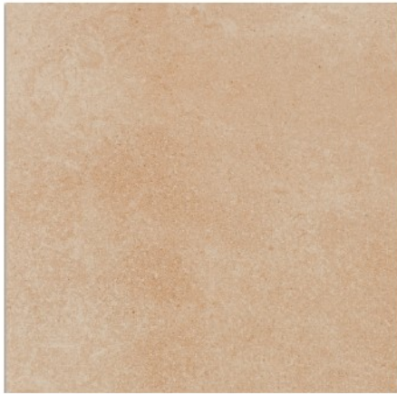
Siena Beige C1 31,6 x 31,6 cm