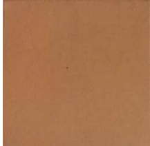
BS28PRENSA Prensado Natural 28x28