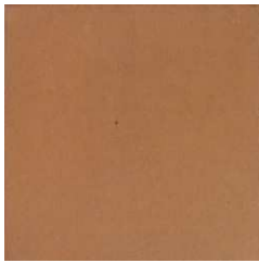
BS31PRENSA Prensado Natural 31,6x31,6