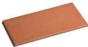
BS14PRENSA Prensado Natural 14x28