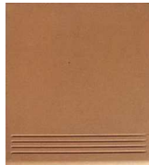
BS28PRENSA-P Peldaño Prensado Natural 28x31