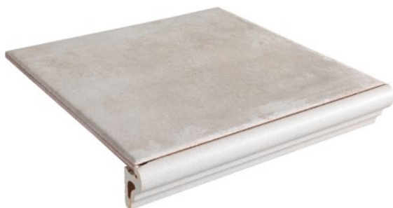
PELDAÑO TORELO SIMPLE (PEGADO)* 31,6 x 31,6 cm**