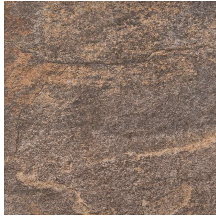
Trujillo Ardesia 31,6 x 31,6 cm