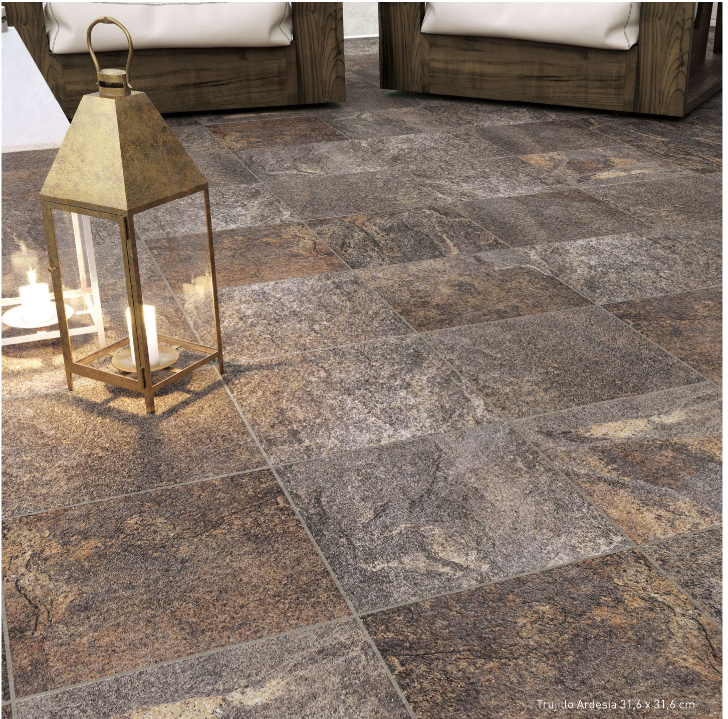
Trujillo Ardesia 31,6 x 31,6 cm