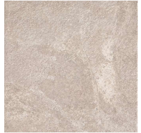
Trujillo Gris 31,6 x 31,6 cm