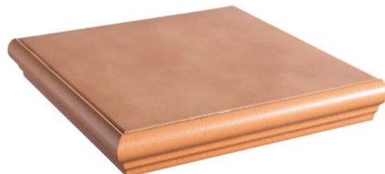
PELDAÑO TORELO DOBLE (PEGADO)* 31,6 x 31,6 cm**

* Se realizan bajo pedido y el plazo de entrega aproximado es de 10 días.