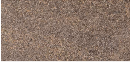
Tabica Trujillo Ardesia 15,7 x 31,6 cm