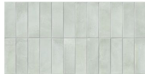
Deco Biscuit Green 32x62,5 / 12,6"x24,6" GF-20355D