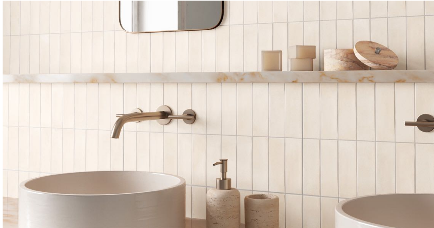
Deco Biscuit Almond 32x62,5 / 12,6"x24,6"