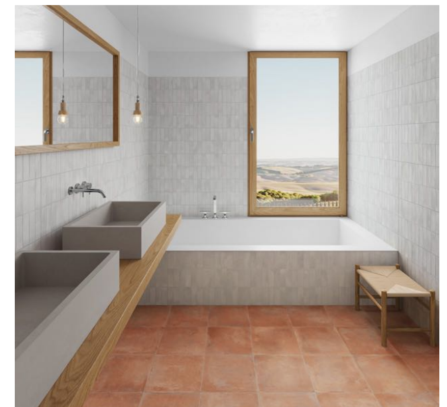
Deco Biscuit Grey 32x62,5 / 12,6"x24,6" · Saona Cotto 33,15x33,15 / 13,1"x13,1"