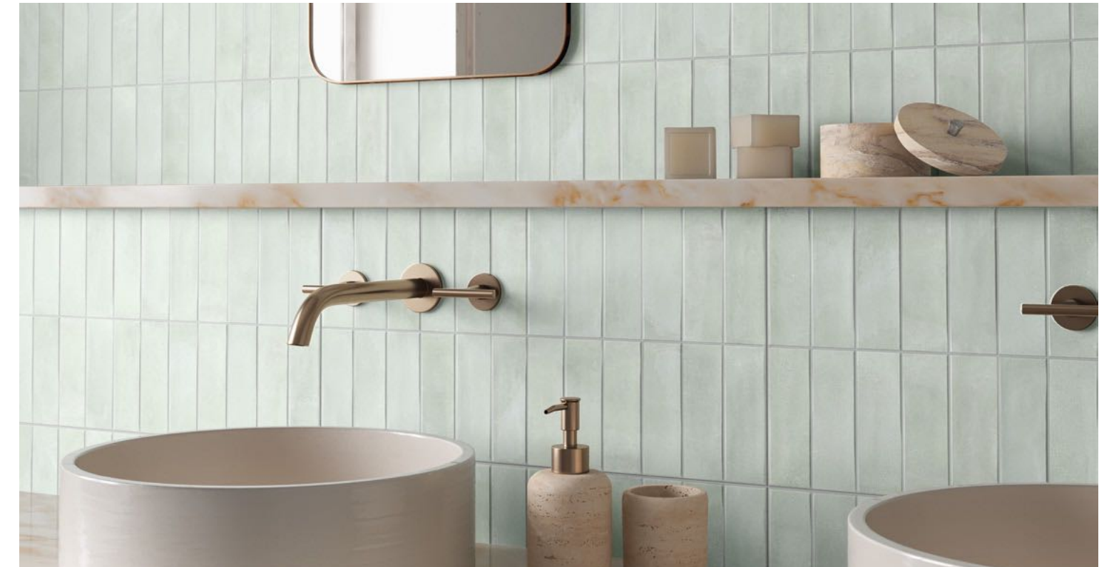
Deco Biscuit Green 32x62,5 / 12,6"x24,6"