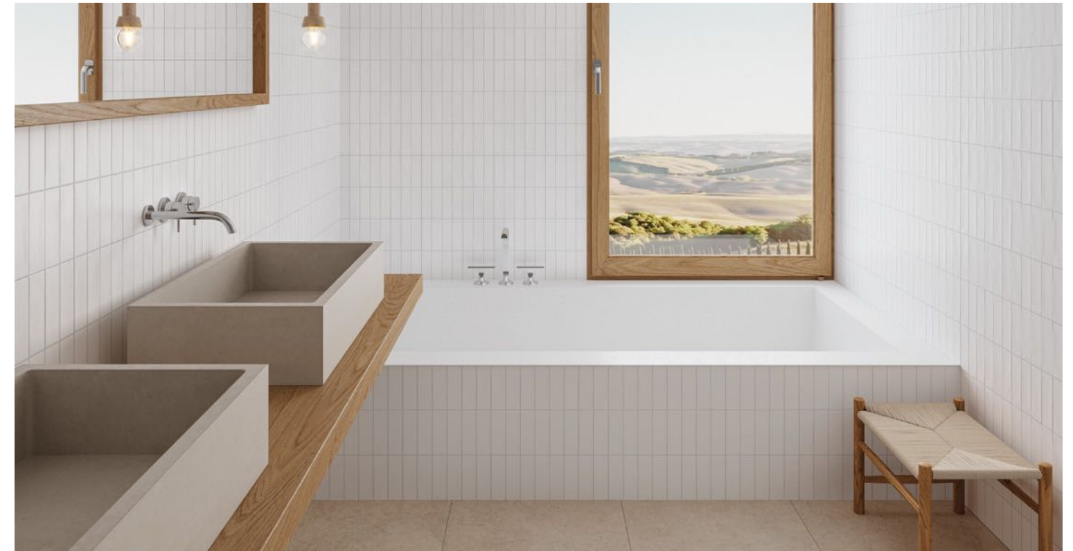
Deco Biscuit White 32x62,5 / 12,6"x24,6" · Rect. Limestone Natural 59,1x119,1 / 23,3"x46,9"