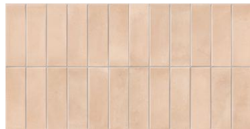
Deco Biscuit Natura 32x62,5 / 12,6"x24,6" GF-20355D