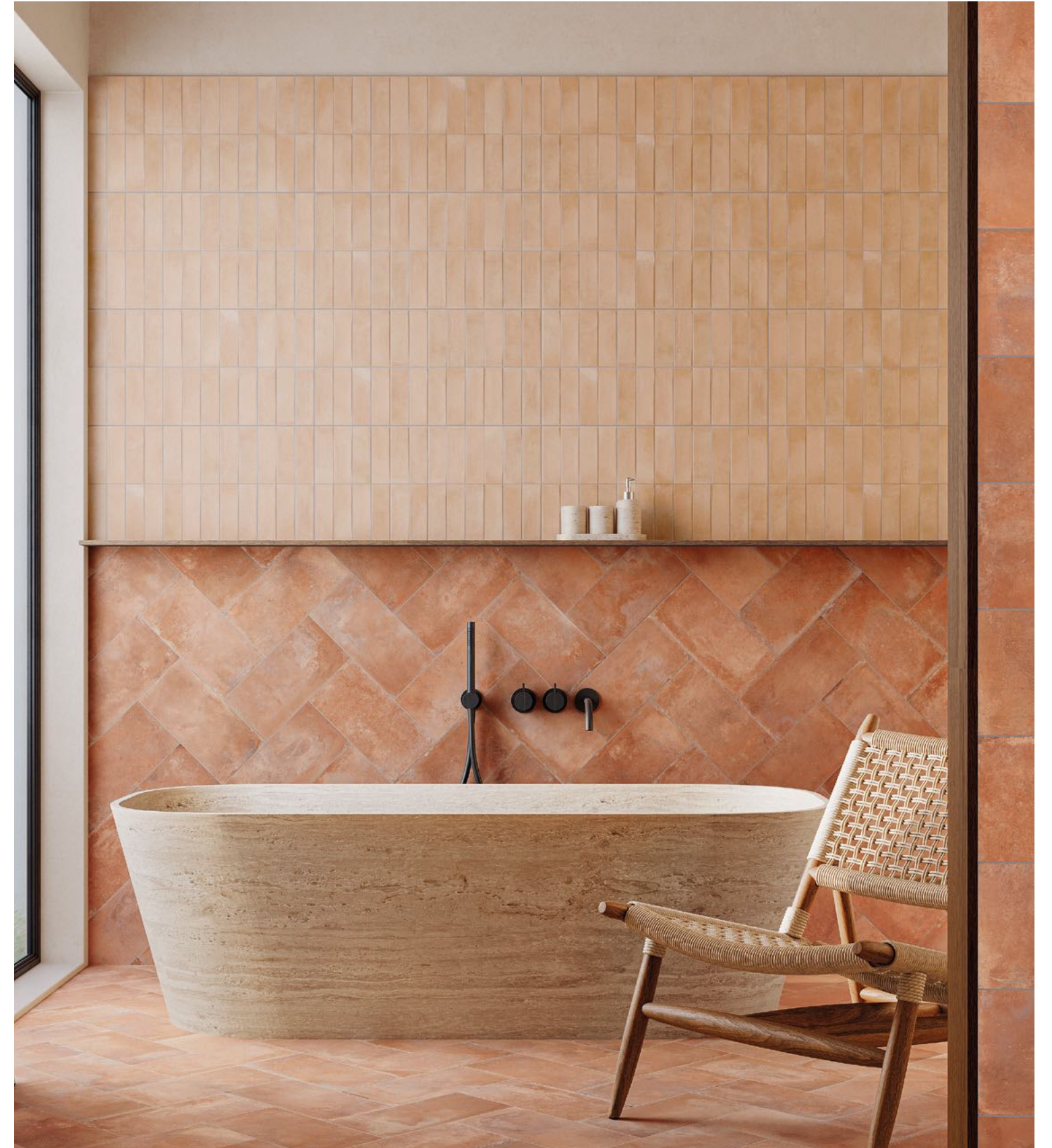
Deco Biscuit Natura 32x62,5 / 12,6"x24,6" · Listelo Saona Cotto 16,5x33,15 / 6,5"x13,1"