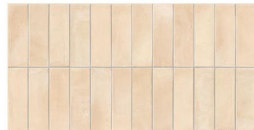
Deco Biscuit Cream 32x62,5 / 12,6"x24,6" GF-20355D