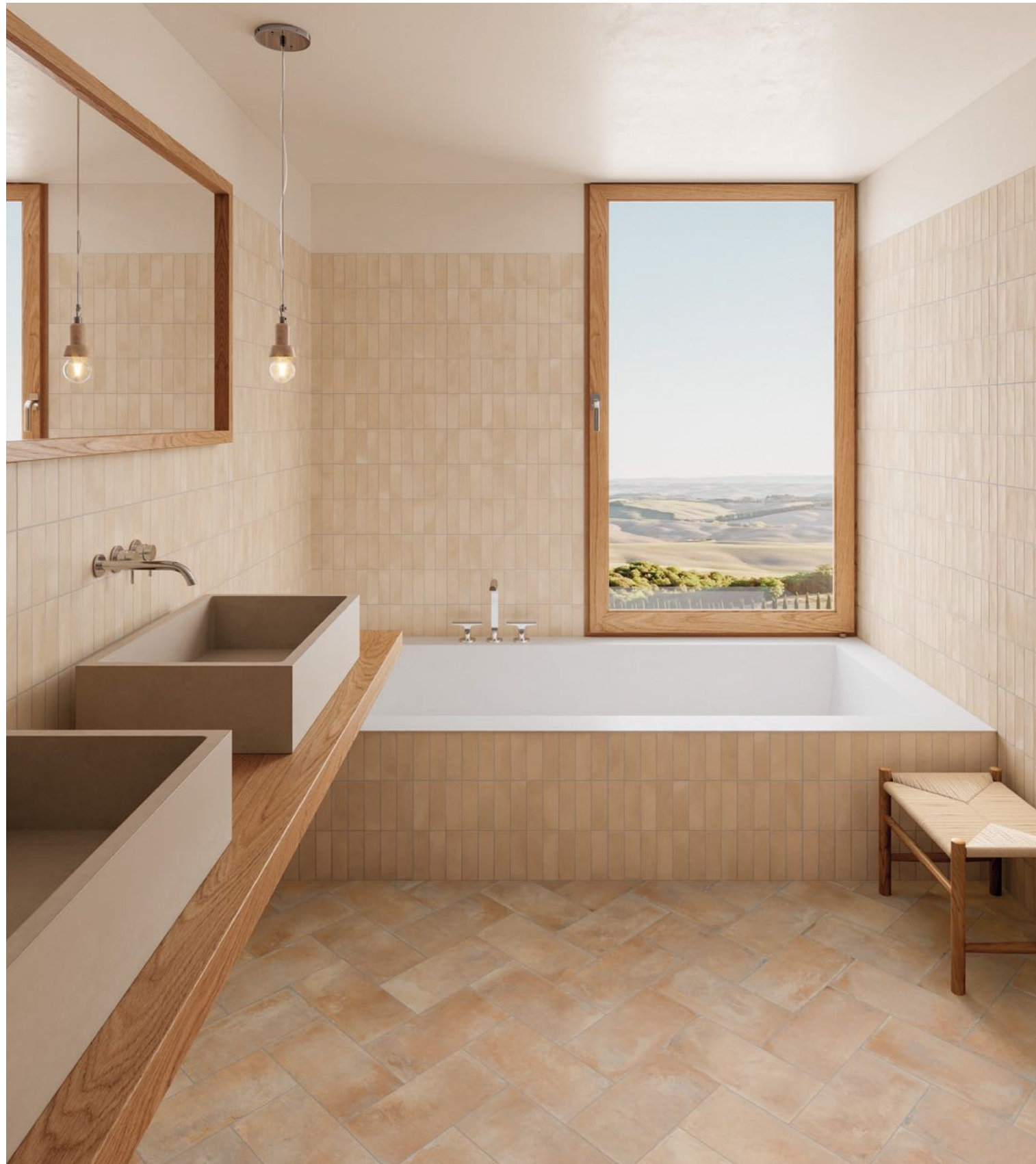
Deco Biscuit Cream 32x62,5 / 12,6"x24,6" · Listelo Saona Chiaro 16,5x33,15 cm / 6,5"x13,1"