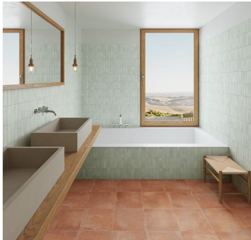
Deco Biscuit Green 32x62,5 / 12,6"x24,6" · Saona Cotto 33,15x33,15 / 13,1"x13,1"