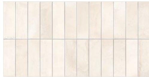
Deco Biscuit Almond 32x62,5 / 12,6"x24,6" GF-20355D