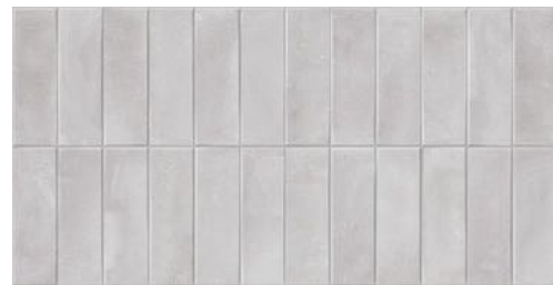
Deco Biscuit Grey 32x62,5 / 12,6"x24,6" GF-20355D