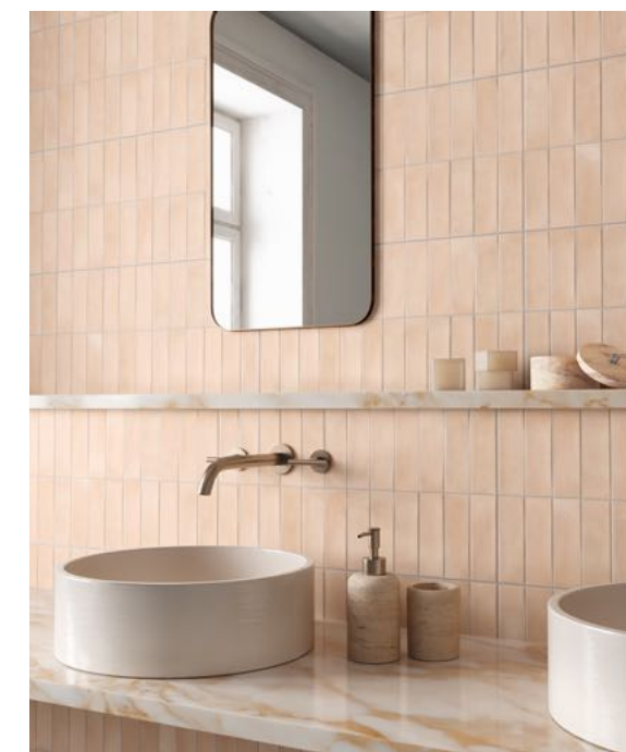
Deco Biscuit Natura 32x62,5 / 12,6"x24,6"