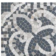
MZ20AUGUSTO Augusto 20x20 MZ-280