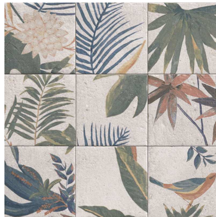
MZ20SAMUI-D Decor Samui 20x20 MZ-280