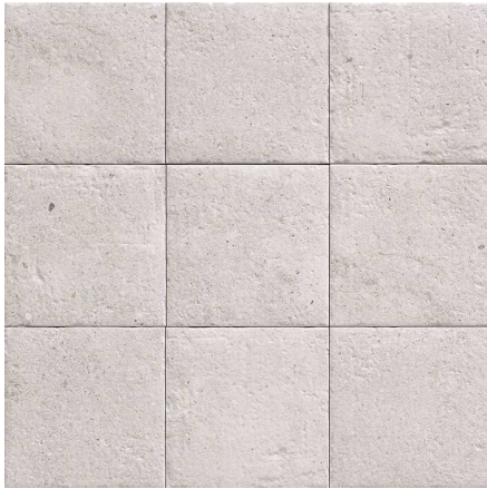
MZ20STONE-W White Stone 20x20 MZ-280