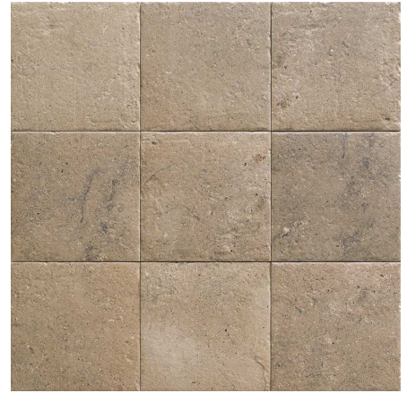
MZ20STONE-S Sand Stone 20x20 MZ-280