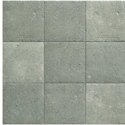
MZ20STONE-G Green Stone 20x20 MZ-280