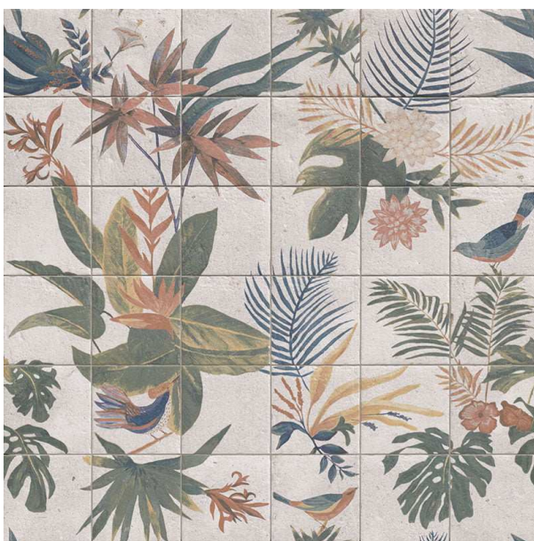
MZ20SAMUI-M Mural Samui 20x20 MZ-1300