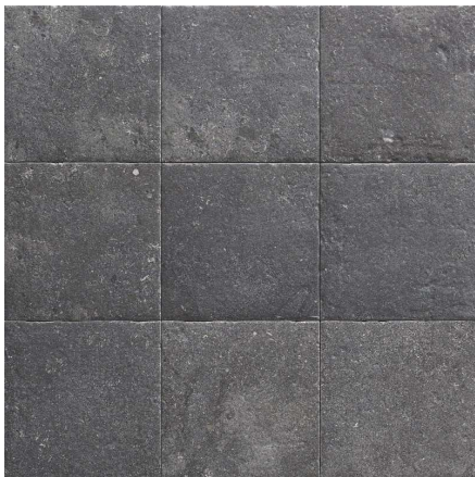
MZ20STONE-L Lava Stone 20x20 MZ-280