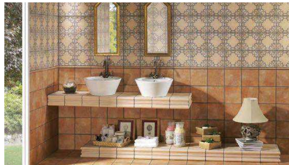
Barro Ocre 20x20 · Barro Crema 20x20 · Decor Barro 1 20x20 · Moldura Barro Ocre 5x20 · Toreto Barro Ocre 2x20 · Toreto Barro Crema 2x20