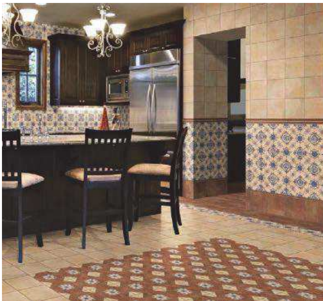
Barro Cotto 20x20 - Barro Crema 20x20 - Decor Barro 2 20x20 - Olhambillas Barro 20x20 Moldura Barro Cotto 5x20 - Torelo Barro Cotto 2x20

TO BE SURROUNDED BY THE AUTHENTIC NATURAL ESSENCE The collection BARROS is a floor tile masterfully done. Rustic and traditional pieces in perfect harmony with the design and the state-of-art offering decorative possibilities.