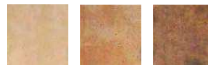
BARRO CREMA 20x20 (M-220) 8"x8"