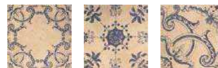
DECOR BARRO 1 20x20 (M-220) 8"x8"