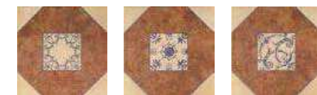
OLHAMBRILLAS BARRO 20x20 (M-220) 8"x8" (3 piezas diferentes por caja) (3 different pieces per box)