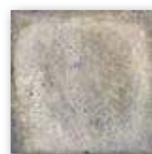
BOLONIA BLUE 20x20 (M-130) 8"x8"