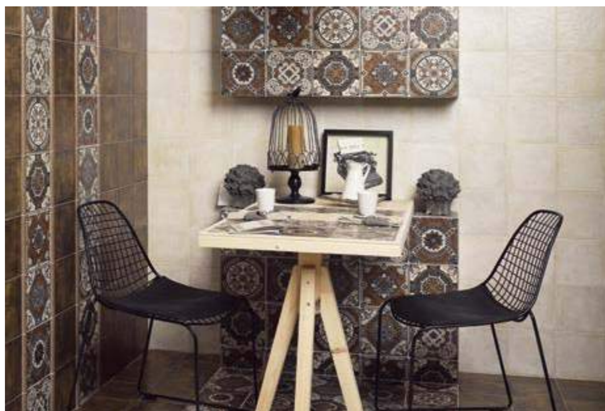
Bolonia Blanco 20x20 · Bolonia Cotto 20x20 · Decor Socarrat 20x20 · Torelo Bolonia Cotto 3x20