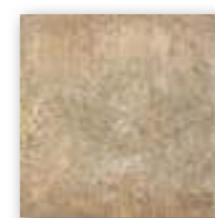
BOLONIA OCRE 20x20 (M-130) 8"x8"