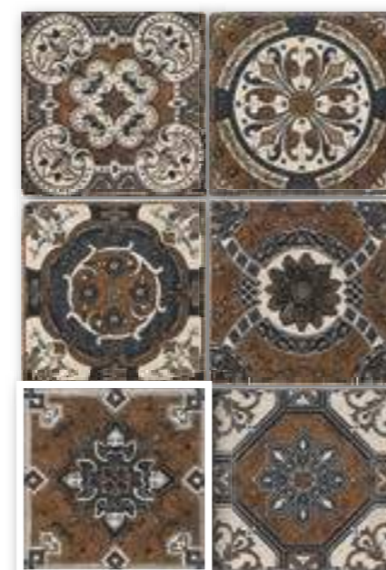
▲ DECOR SOCARRAT 20x20 (M-220) 8"x8"