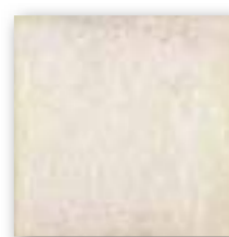
BOLONIA BLANCO 20x20 (M-130) 8"x8"