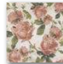
DECOR MIRAMONTE 20x20 (M-220) 8"x8"