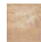
FORLÌ CREAM 20x20 · 8"x8" (M-220)