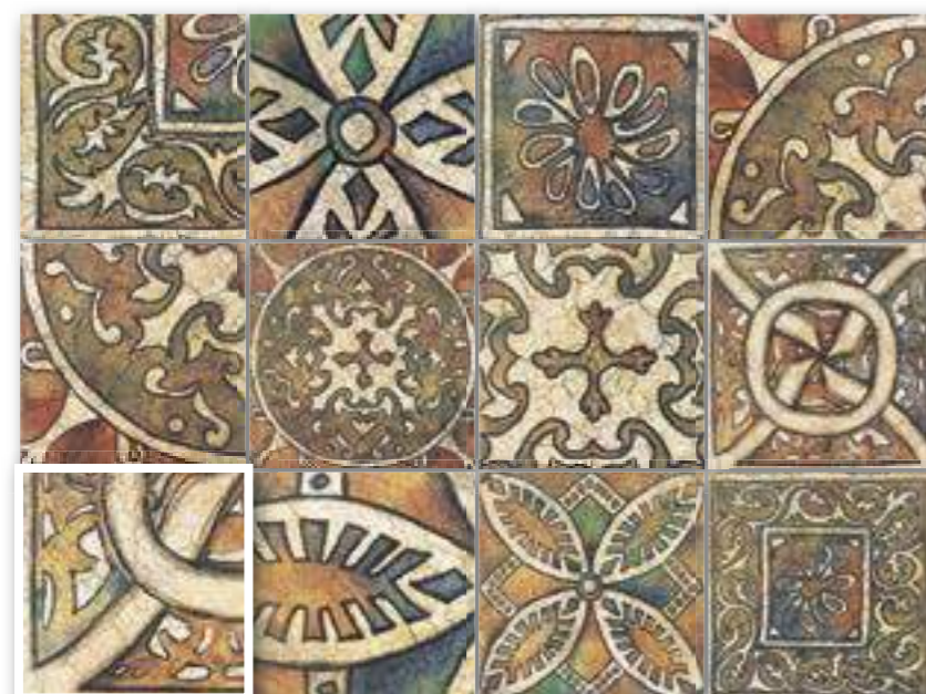
▲ DECOR MEDIEVO 20x20 (M-220) 8"x8"