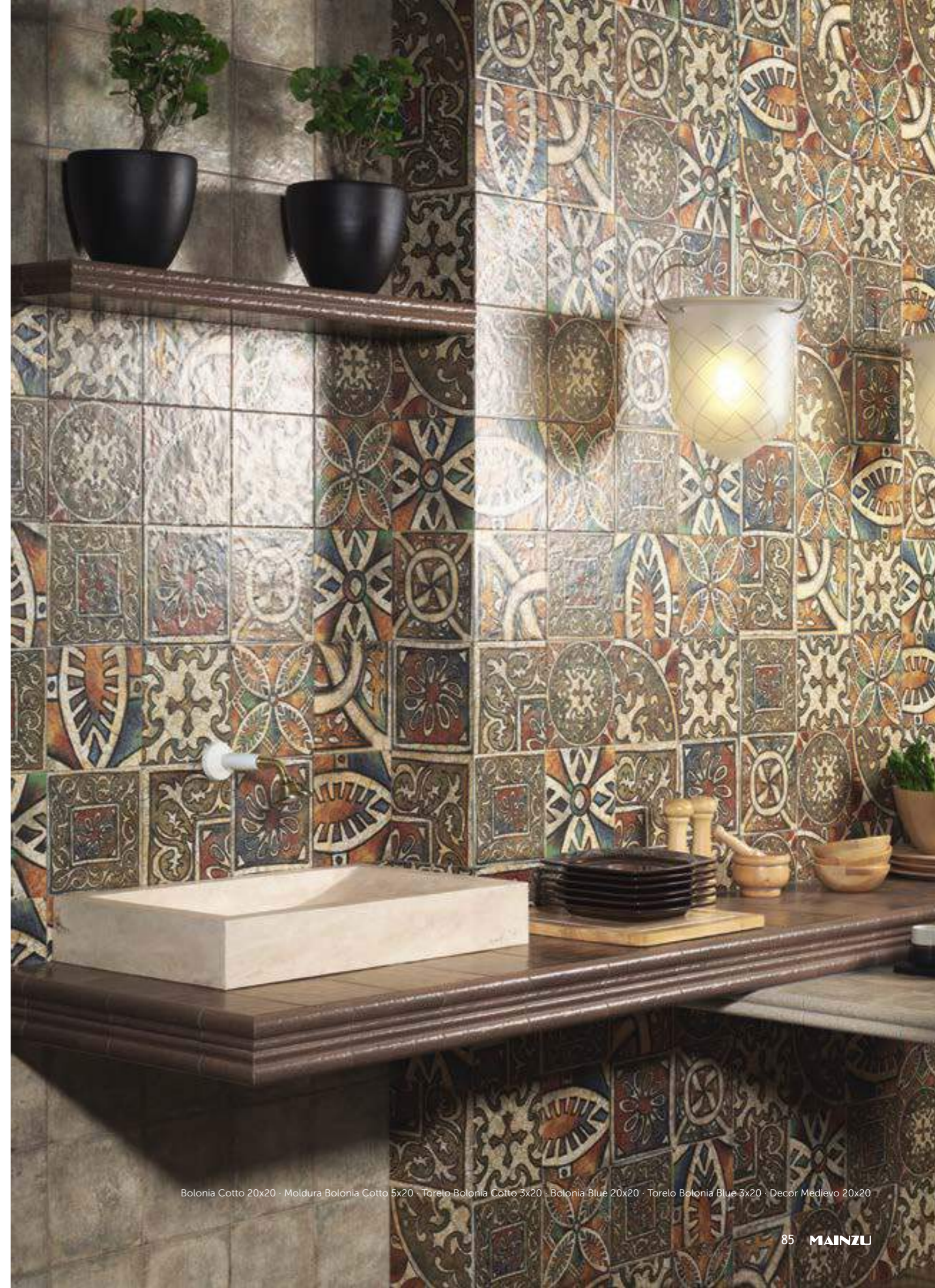
Bolonia Cotto 20x20 · Moldura Bolonia Cotto 5x20 · Torelo Bolonia Cotto 3x20 · Bolonia Blue 20x20 · Torelo Bolonia Blue 3x20 · Decor Medievo 20x20