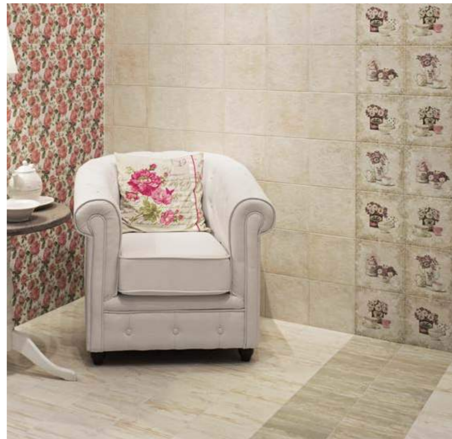
Bolonia Blanco 20x20 · Decor Solferino 20x20 · Decor Miramonte 20x20 · Pav. Pacific Green 20x20 · Pav. Pacific Blanco 20x20