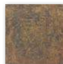
BOLONIA COTTO 20x20 (M-130) 8"x8"