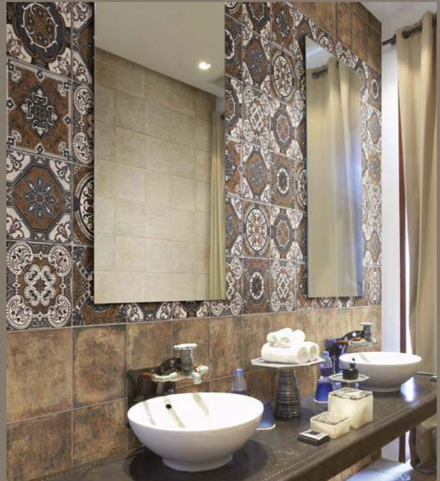
Bolonia Cotto 20x20 - Decor Socarrat 20x20