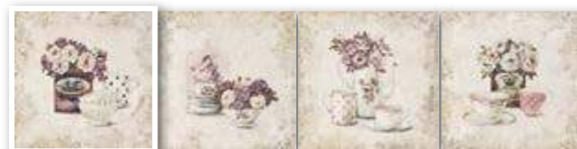
▲ DECOR SOLFERINO 20x20 (M-220) 8"x8" (4 piezas diferentes)