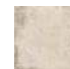
NORLAND WHITE 20x20 · 8"x8" (M-280)