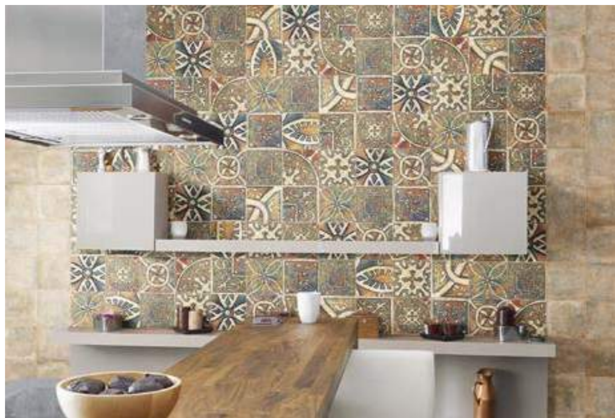
Bolonia Ocre 20x20 · Decor Medievo 20x20