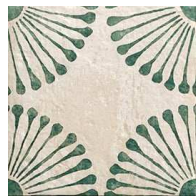
MZ20PALMA Carino Deco Palma 20x20 MZ-280