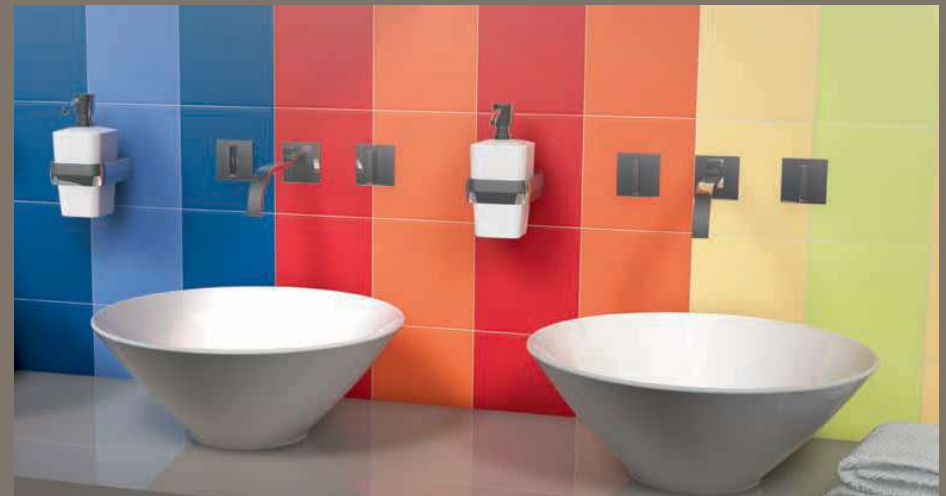
Azul Medio Mate 20x20 · 8"x8" · Azul Oscuro Mate 20x20 · 8"x8" · Naranja Mate 20x20 · 8"x8" · Rojo Mate 20x20 · 8"x8" · Amarillo Mate 20x20 · 8"x8" · Pistacho Mate 20x20 · 8"x8"