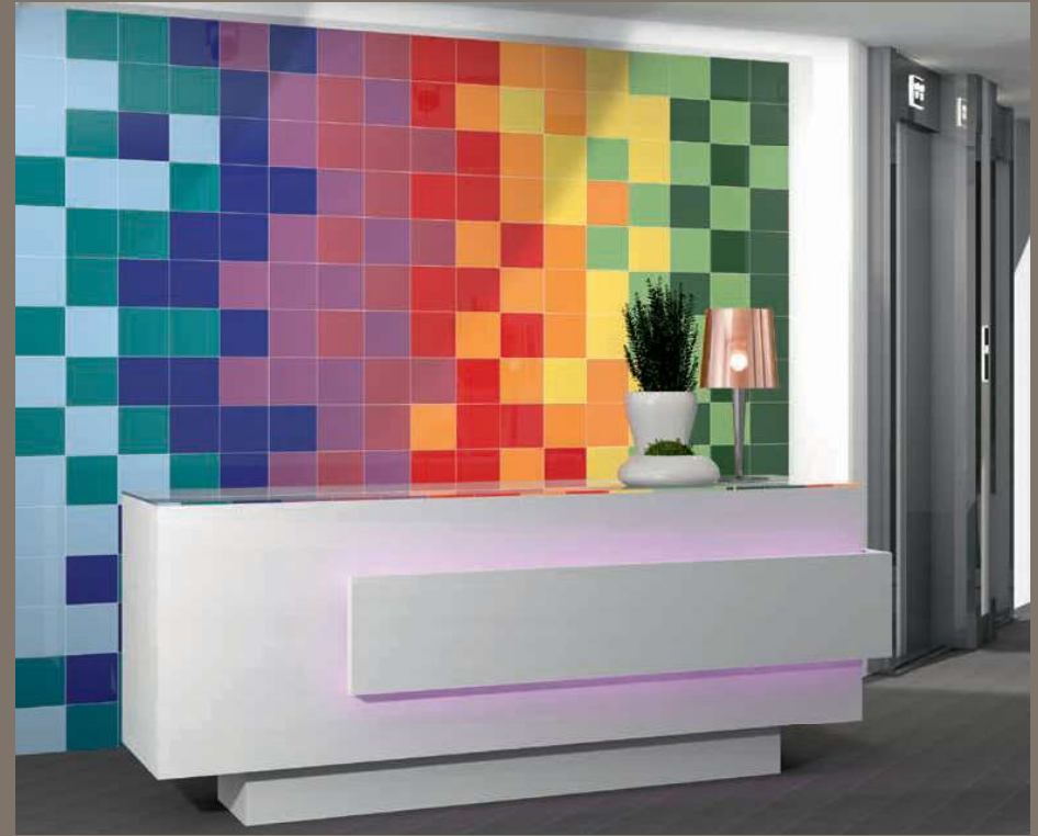
Cobalto Brillo 20x20 · 8"x8" · Viola Brillo 20x20 · 8"x8" · Rosso Brillo 20x20 · 8"x8" · Rojo Brillo 20x20 · 8"x8" · Arancio Brillo 20x20 · 8"x8" · Amarillo Brillo 20x20 · 8"x8" · Pistacho Brillo 20x20 · 8"x8" · Verde Brillo 20x20 · 8"x8"