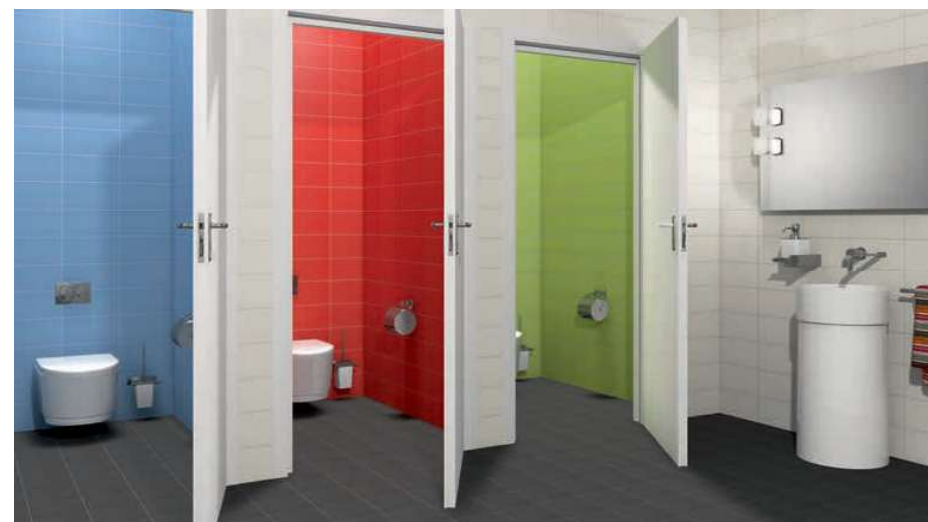
Matt Blanco 15x30 · 6"x12" · Matt Azul 15x30 · 6"x12" · Matt Rosso 15x30 · 6"x12" · Matt Pistacho 15x30 · 6"x12" · Victorian Gris 20x20 · 8"x8" (Ver serie completa en pág. 92 / Check complete serie in page 92)