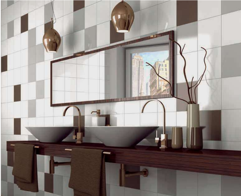
Gris Brillo 20x20 · 8"x8" · Gris Perla Brillo 20x20 · 8"x8" · Café Brillo 20x20 · 8"x8"