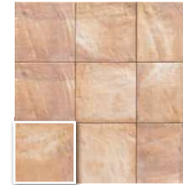
FORLÌ CREAM 20x20 (M 220) 8"x8"