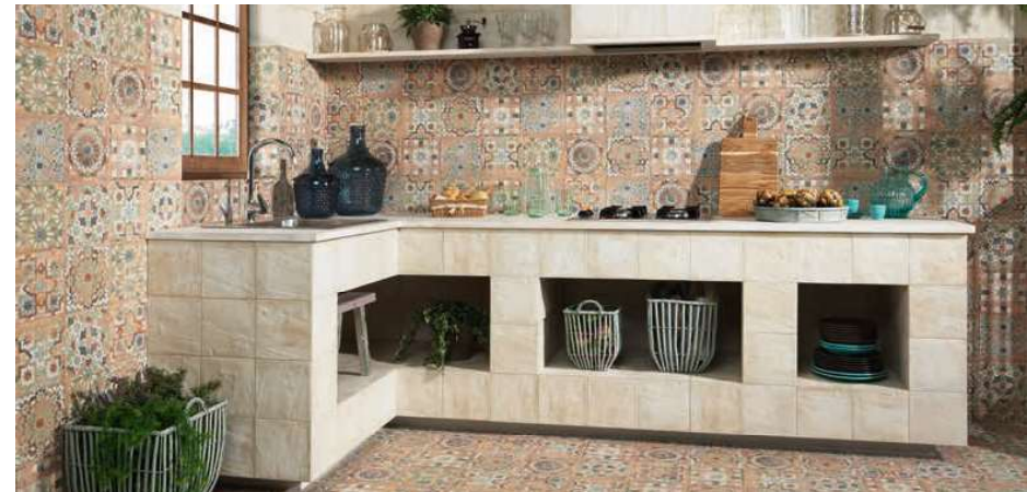
Forlì White 20x20 · 8"x8" · Sforza 20x20 · 8"x8"