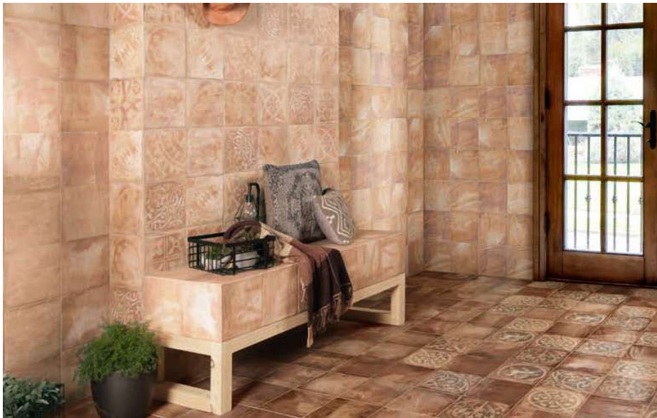
74 Forlì Cream 20x20 · 8"x8" · Teano 20x20 · 8"x8" · Forlì Cotto 20x20 · 8"x8" · Lomba 20x20 · 8"x8"