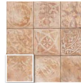
TEANO 20x20 (M 220) 8"x8"