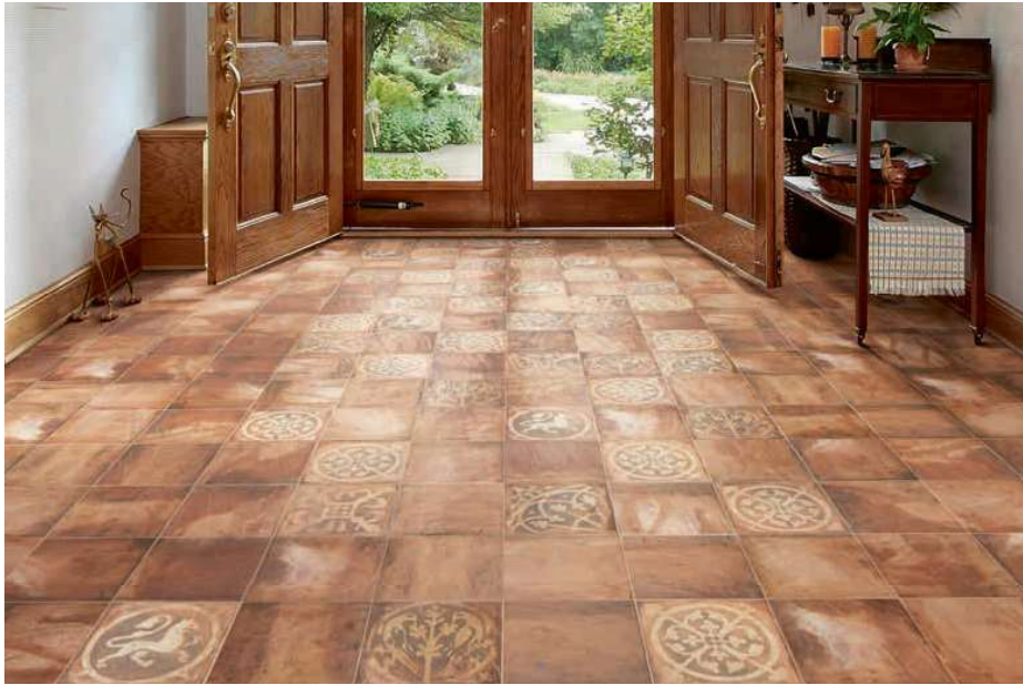
Forlì Cotto 20x20 · 8"x8" · Lomba 20x20 · 8"x8"