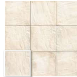
FORLÌ WHITE 20x20 (M 220) 8"x8"