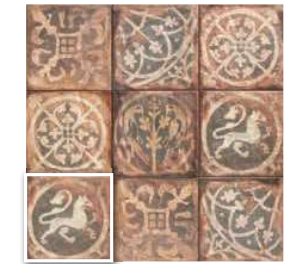
LOMBA 20x20 (M 220) 8"x8"