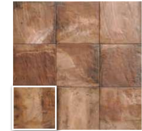
FORLÌ COTTO 20x20 (M 220) 8"x8"