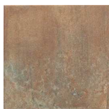
MZ20LAND-CO Land Cotto 20x20 MZ-280