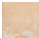
MMZ20LAND-CR Land Cream 20x20 MZ-280