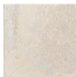
MZ20LAND-W Land White 20x20 MZ-280