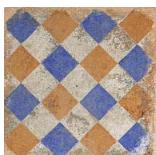
MZ20NATIVE Native 20x20 MZ-280