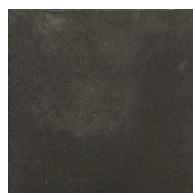
MZ20NOSTA-BK Nostalg Black 20x20 MZ-280