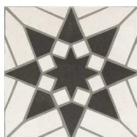
MZ20SEVILL-W Sevilla White 20x20 MZ-280