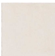
MZ20NOSTA-W Nostalg White 20x20 MZ-280