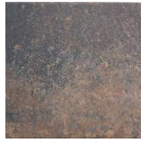
MZ200OXO-M Oxo Metal 20x20 MZ-280