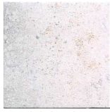
MZ200OXO-W Oxo White 20x20 MZ-280