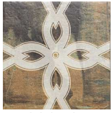
MZ200OXO-L Oxo Link 20x20 MZ-280