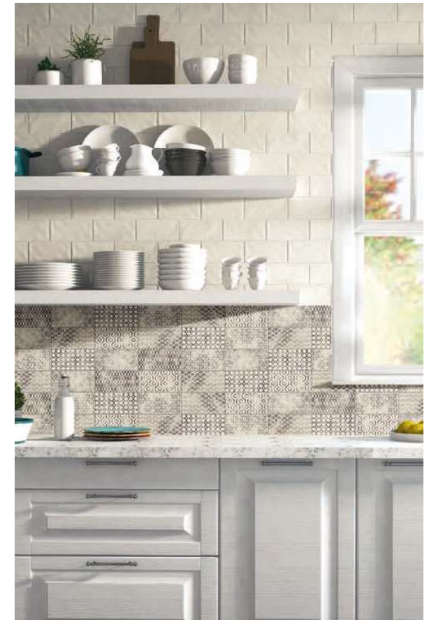
Ravena 10 Blanco 10x20 · 4"x8" - Decor Fabio Blanco 10x20 · 4"x8"