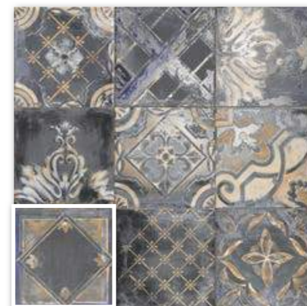
▲ RICORDI AZURRO 20x20 (M-220) 8"x8"