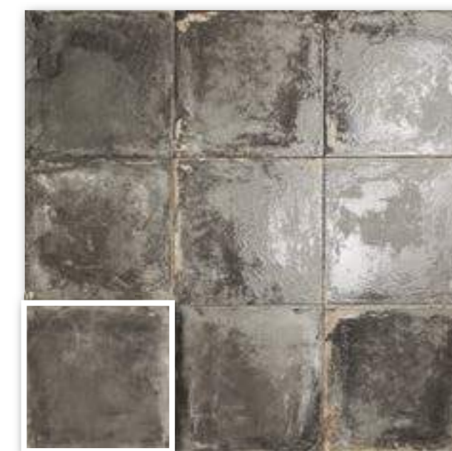
▲ VENEZIA NERO 20x20 (M-152) 8"x8"