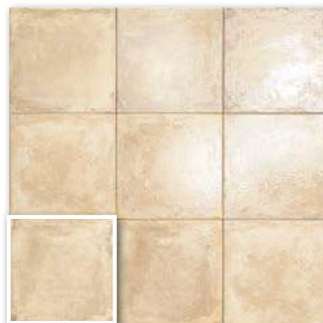
▲ VENEZIA CREAM 20x20 (M-152) 8"x8"