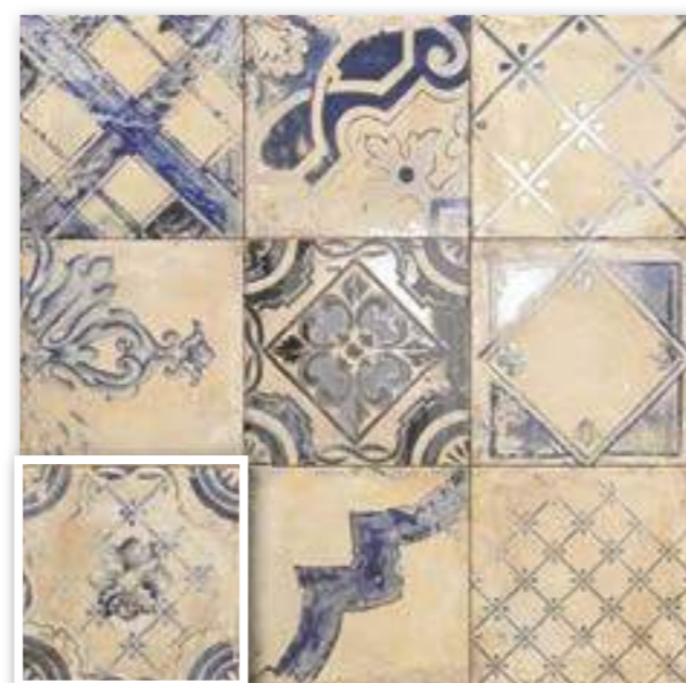
▲ RICORDI CREAM 20x20 (M-220) 8"x8"