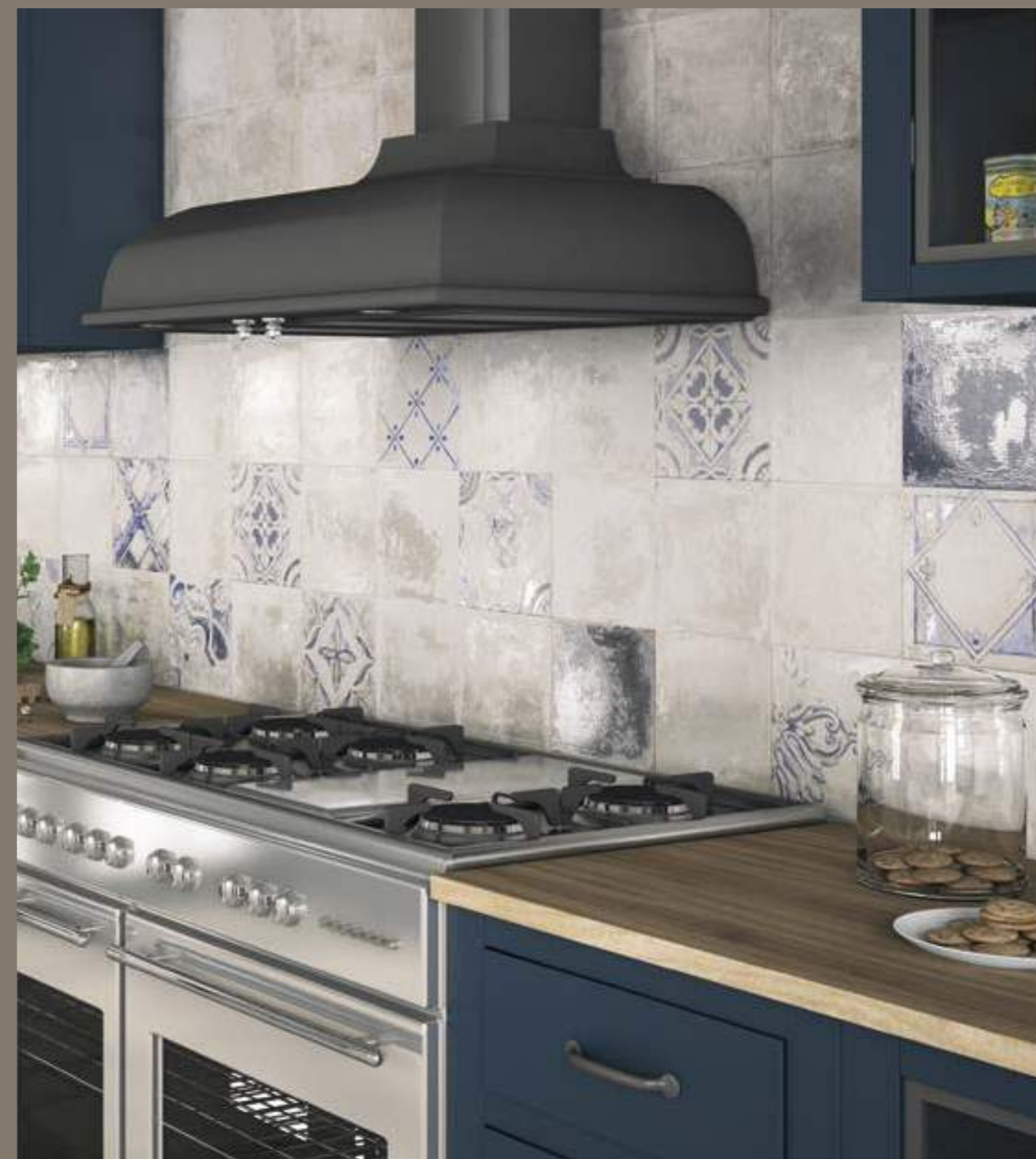
Venezia Bianco 20x20 · Venezia Azzurro 20x20 · Ricordi Bianco 20x20