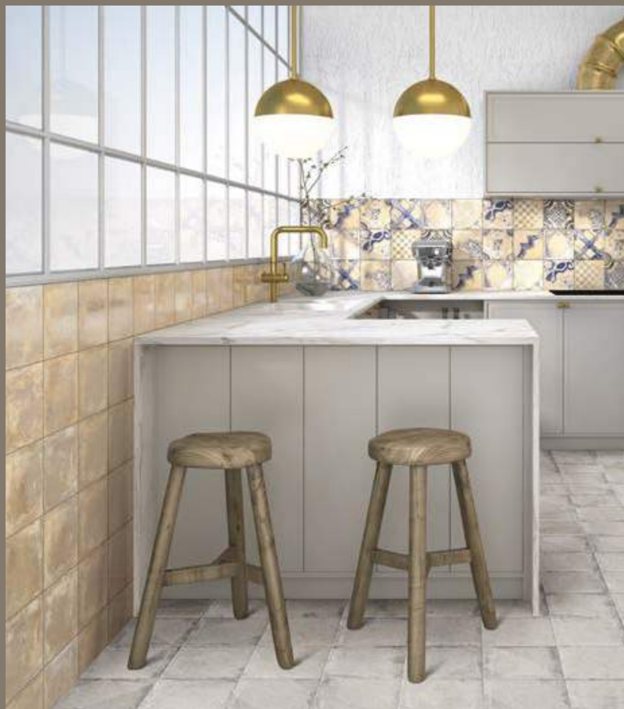
Venezia Cream 20x20 · Ricordi Cream 20x20 · Norland Grey 20x20