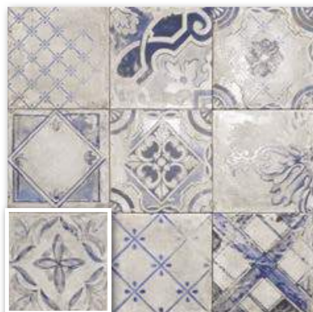
▲ RICORDI BIANCO 20x20 (M-220) 8"x8"