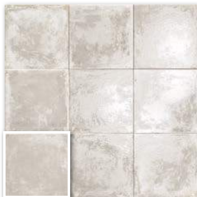
▲ VENEZIA BIANCO 20x20 (M-152) 8"x8"