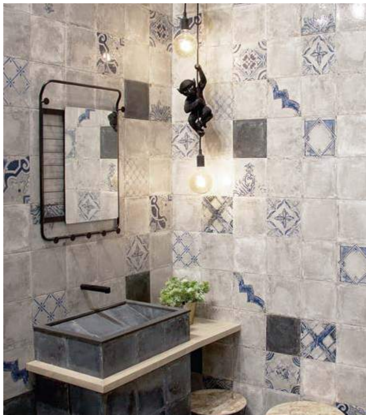
Venezia Bianco 20x20 · Venezia Azzurro 20x20 · Ricordi Bianco 20x20