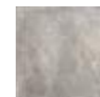
DAVALOS NATURAL 20x20 - 8"x8" (M-280)