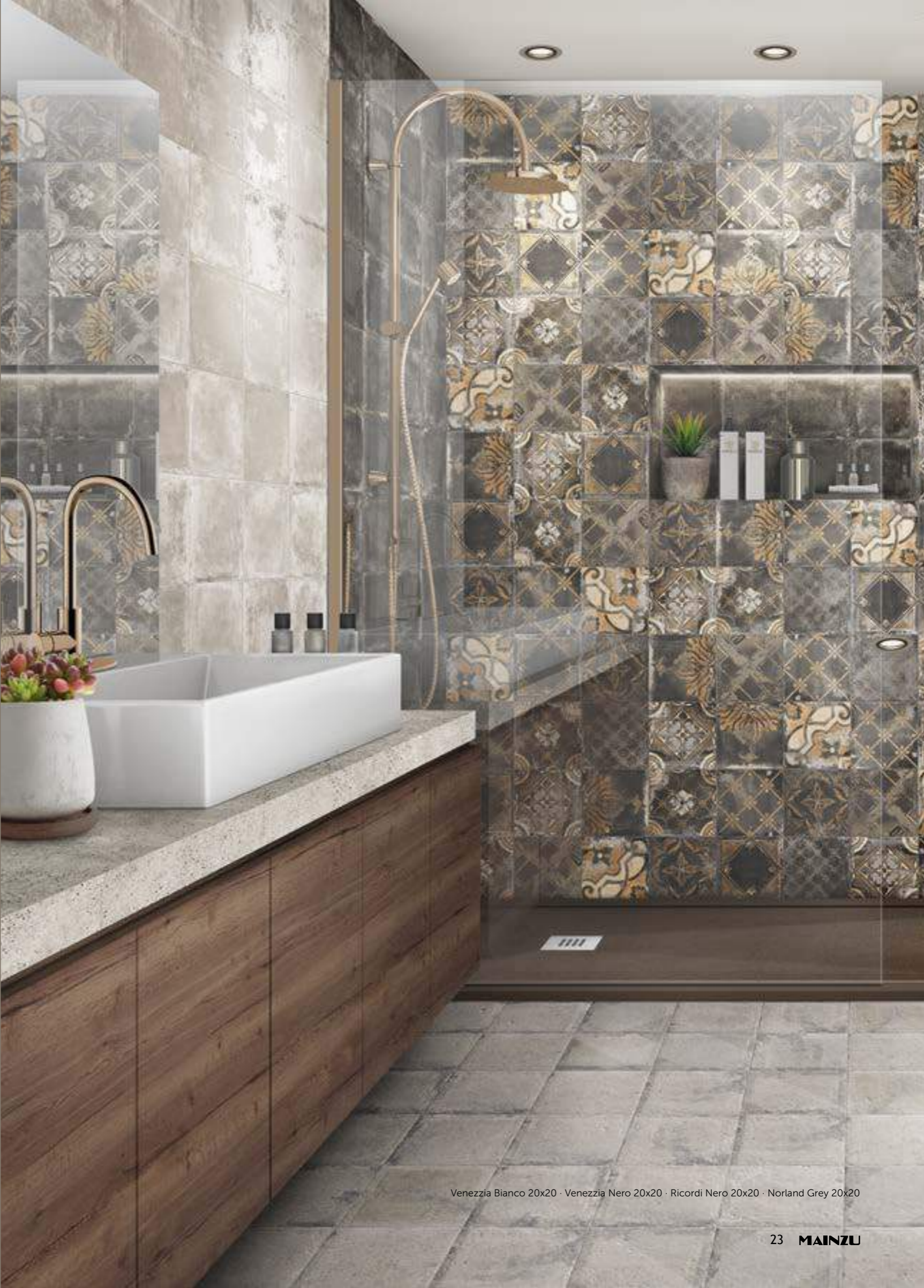
Venezia Bianco 20x20 · Venezia Nero 20x20 · Ricordi Nero 20x20 · Norland Grey 20x20