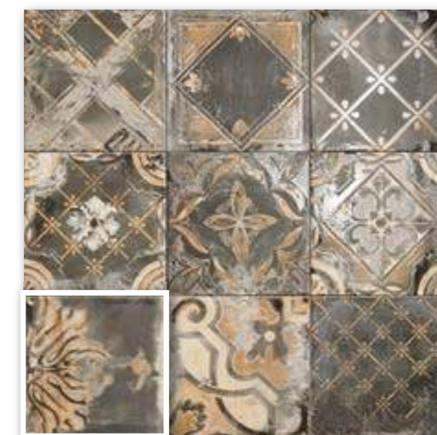
▲ RICORDI NERO 20x20 (M-220) 8"x8"