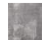
DAVALOS DARK 20x20 - 8"x8" (M-280)

Ver serie completa en CATÁLOGO NOVEDADES CERSAIE'19 Check complete serie in CERSAIE'19 NOVELTIES CATALOGUE