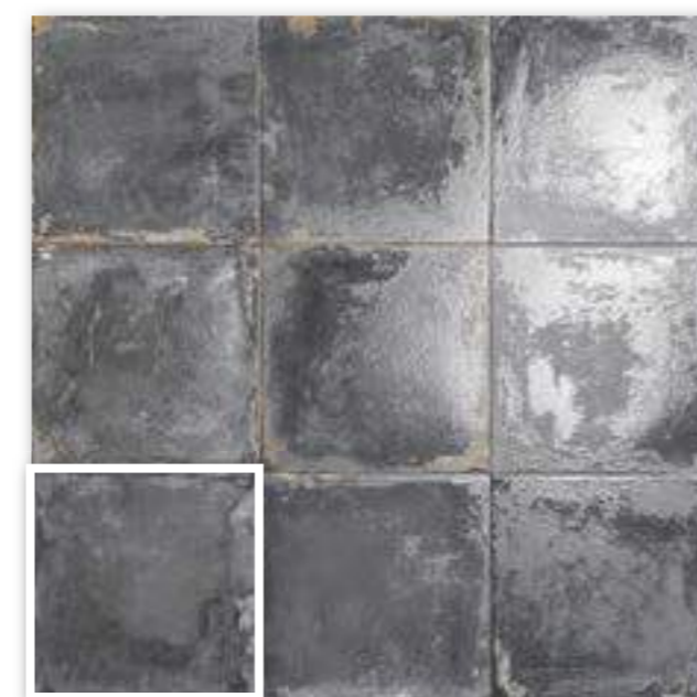
▲ VENEZIA AZURRO 20x20 (M-152) 8"x8"