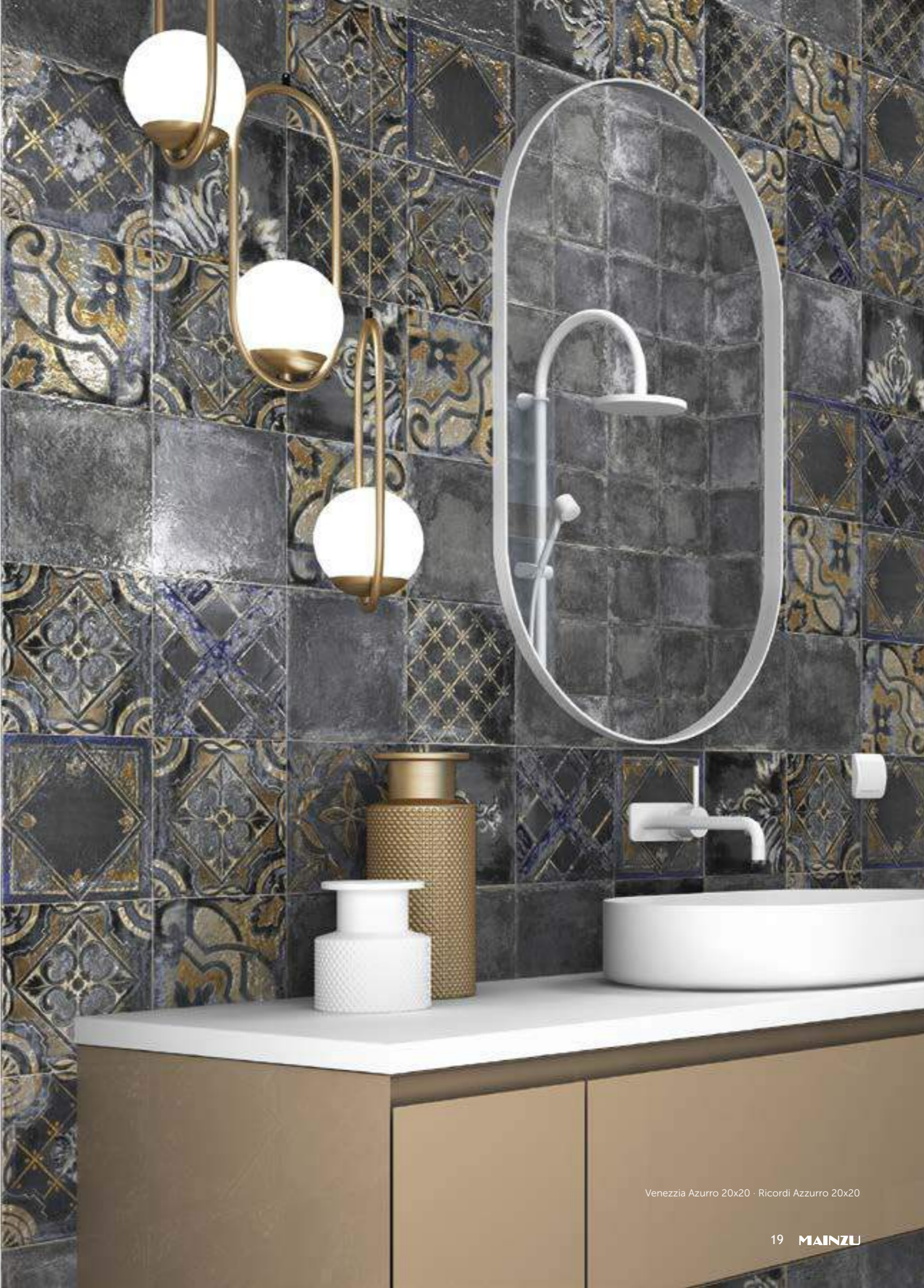
Venezia Azzurro 20x20 · Ricordi Azzurro 20x20