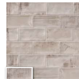
VERONA 10 GRIS 10x20 (M 190) 4"x8"