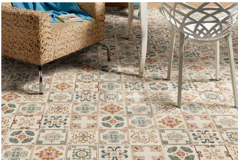
112 Pav. Verona Decor 20x20 · 8"x8"