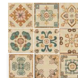
PAV. VERONA DECOR 20x20 (M 220) 8"x8"