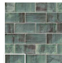
VERONA 10 VERDE 10x20 (M 190) 4"x8"