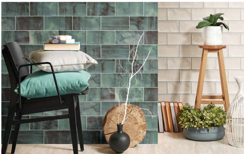
Verona 10 Ice · 10x20 · 4"x8" · Verona 10 Verde · 10x20 · 4"x8"