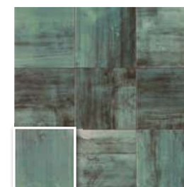
PAV. VERONA VERDE 20x20 (M 220) 8"x8"