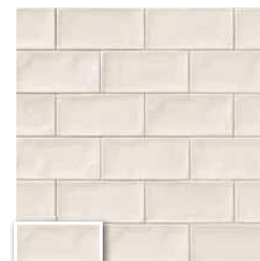
VERONA 10 ICE 10x20 (M 190) 4"x8"