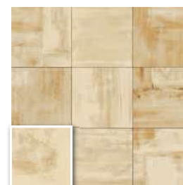
PAV. VERONA BLANCO 20x20 (M 220) 8"x8"