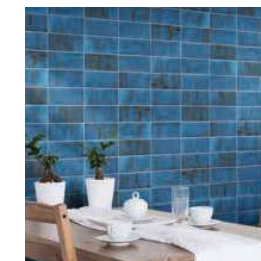
Verona 10 Blu 10x20 · 4"x8"