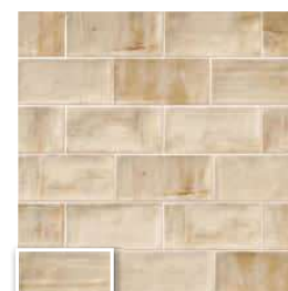
VERONA 10 BLANCO 10x20 (M 190) 4"x8"