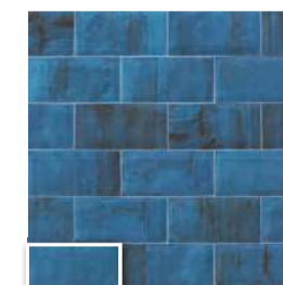
VERONA 10 BLU 10x20 (M 190) 4"x8"