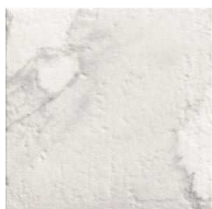
MZ20HERMIT-L Hermitage Light 20x20 MZ-280