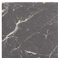
MZ20HERMIT-D Hermitage Dark 20x20 MZ-280