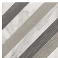
MZ20VERSA-WO Versailles WOOD 20x20 MZ-280