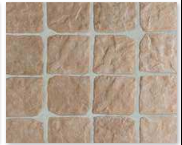
Yosemite 15 Beige