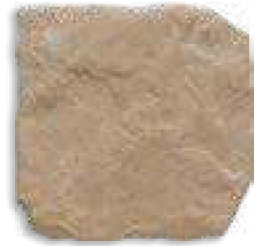
Yosemite 15 Beige 11mm PEI IV