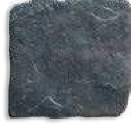
Yosemite 15 Antracita 11mm PEI III