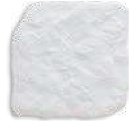
Yosemite 15 Blanco 11mm PEI IV

* Apto para tráfico pesado Suitable for heavy transit Valable pour trafic intensif