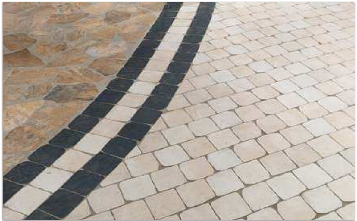
Yosemite 15 Antracita, Country 15 Bone, Montesa L, M & S Marrón