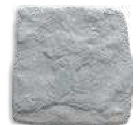
Yosemite 15 Gris 11mm PEI IV