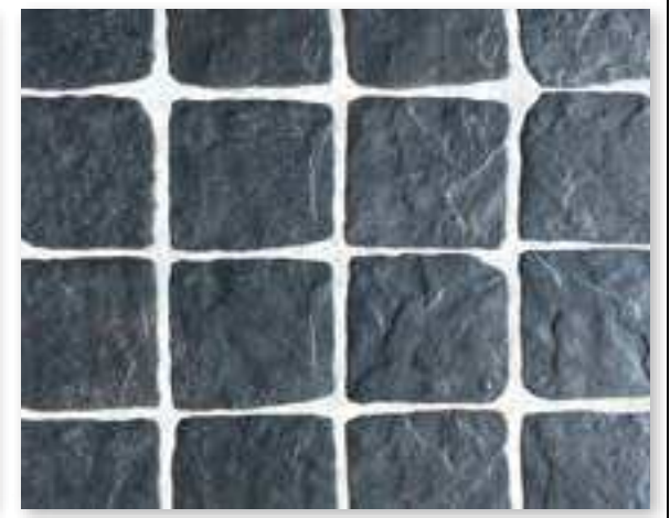
Yosemite 15 Antracita