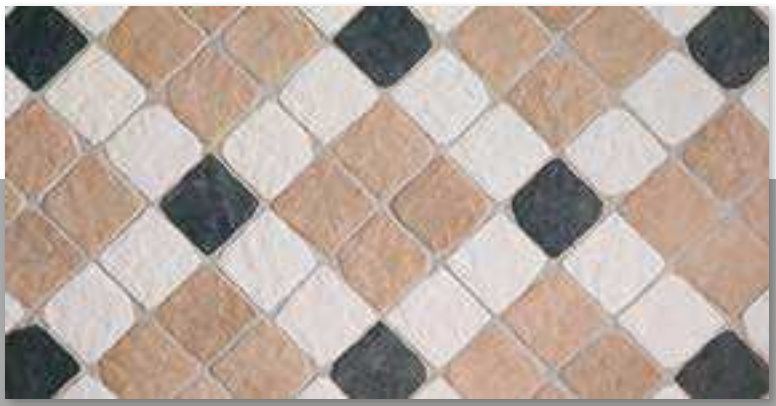
Yosemite 15 Blanco, Beige & Antracita