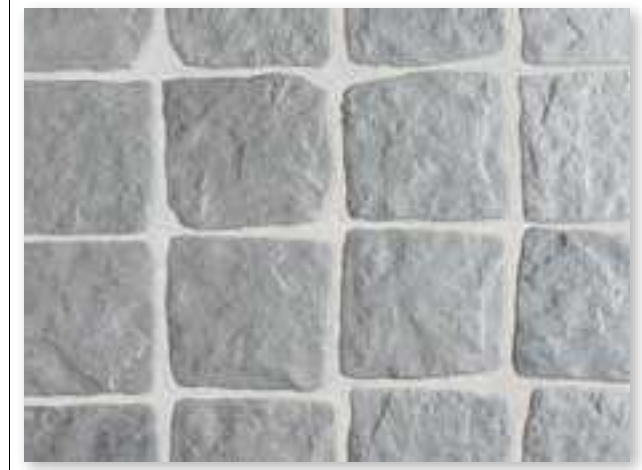
Yosemite 15 Gris