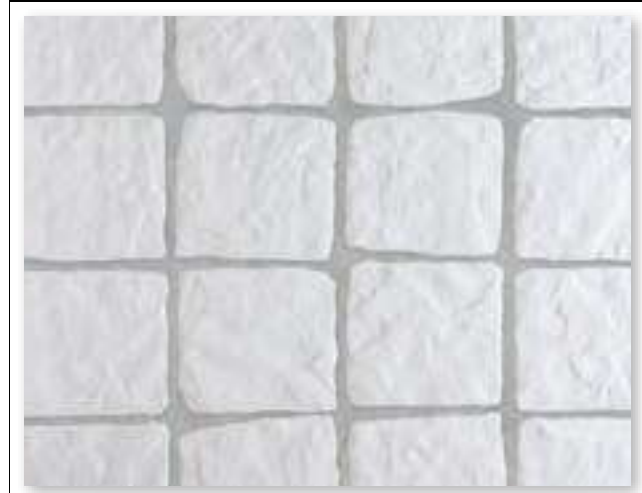
Yosemite 15 Blanco